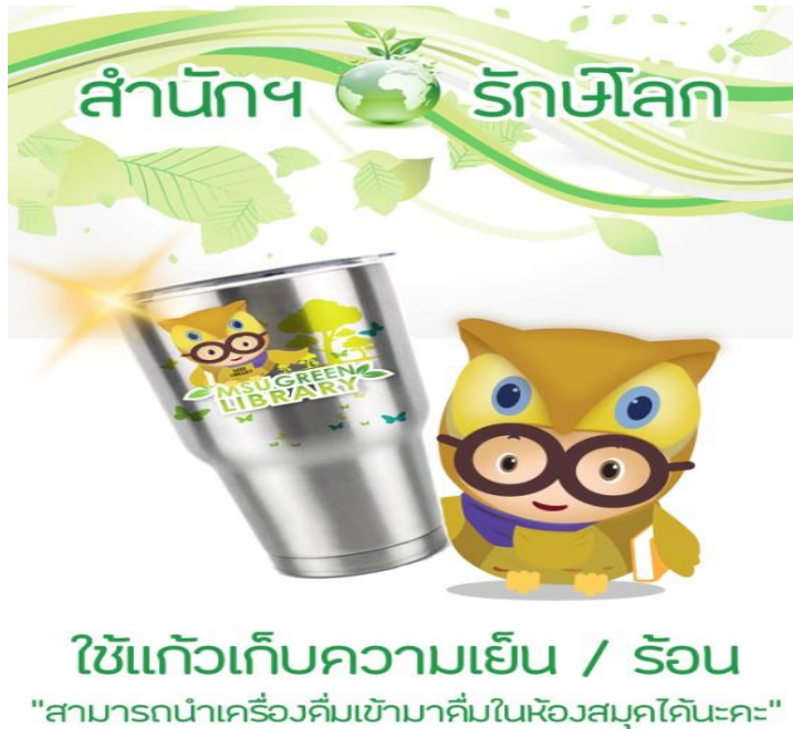
ภาพที่ 1 โปสเตอร์รณรงค์การใช้แก้วส่วนตัว

3. นำผลที่ได้จากการศึกษางานวิจัย และผลจากการจัดกิจกรรมแลกเปลี่ยนเรียนรู้ของผู้ปฏิบัติงานมาวิเคราะห์และจัดอันดับความสำคัญและปัญหาที่เกิดขึ้นและปัญหาที่ควรได้รับการแก้ไขมาออกแบบกิจกรรม จึงนำแนวคิดห้องสมุดสีเขียวในการลดการใช้แก้วพลาสติกด้วยการใช้แก้วส่วนตัวที่มีคุณสมบัติเก็บความร้อน/ เย็น ที่ไม่มีการระเหยของไอน้ำข้างแก้ว และมีฝาปิดมิดชิด ไม่ส่งกลิ่นรบกวนผู้อื่น