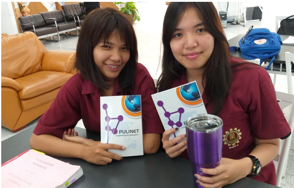
ภาพที่ 4 ผู้ใช้บริการที่นำแก้วส่วนตัวเข้าห้องสมุด

“กิจกรรมแก้วเล็ก ๆ เปลี่ยนโลก ใช้แก้วเก็บความเย็น เข้ามาเก็บความรู้” ได้รับความสนใจจากลูกค้าเป็นอย่างมาก มีผู้เข้าร่วมกิจกรรมและนำแก้วส่วนตัวมาใช้กันอย่างแพร่หลาย เพราะเห็นถึงประโยชน์ที่ได้รับจากกิจกรรม นอกจากจะสามารถตอบสนองความต้องการของผู้ใช้บริการให้สามารถนำเครื่องดื่มเข้ามารับประทานในห้องสมุดได้แล้ว ผู้ใช้บริการยังได้รับของรางวัลและสิทธิพิเศษจากห้องสมุดและส่วนลดจากร้านค้าที่เข้าร่วมกิจกรรม และยังช่วยลดการใช้แก้วพลาสติกในห้องสมุดและมหาวิทยาลัยอีกด้วย ผลการประเมินความพึงพอใจ พบว่า ผู้ใช้บริการความพึงพอใจในการเข้าร่วมกิจกรรมในภาพรวมระดับมากที่สุด ( \bar{X} = 4.59 ) ผู้ประกอบการที่จำหน่ายเครื่องดื่มเข้าร่วมโครงการกว่า 10 ร้านค้า และระบุว่ากิจกรรมดังกล่าวช่วยส่งเสริมยอดขายได้เป็นอย่างดี