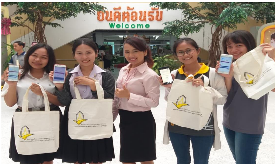
ภาพที่ 5 ผู้ใช้บริการนำแต้มมาแลกของรางวัล

เมื่อกิจกรรมสามารถตอบสนองความต้องการของผู้ใช้บริการได้ ย่อมส่งผลถึงความสุขที่ได้จากการมาใช้บริการในห้องสมุด ผู้ใช้บริการมีพื้นที่นั่งอ่านและมีเครื่องดื่มแก้กระหาย ทำให้เกิดสมาธิในการอ่าน นอกจากนี้ยังได้สิทธิประโยชน์ในการเข้าร่วมกิจกรรม เช่น ได้รับส่วนลดจากร้านค้าที่เข้าร่วมกิจกรรมสามารถสะสมแต้มจากการเข้าร่วมกิจกรรมเพื่อรับรางวัลและเป็นส่วนหนึ่งในการรักษาสีสิ่งแวดล้อมอีกด้วย