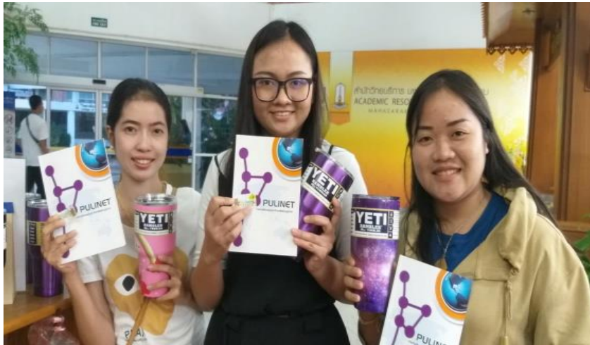
ภาพที่ 2 ผู้ใช้บริการที่เข้าร่วมกิจกรรม

5.5 ทุกครั้งที่นำแก้วส่วนตัวเข้ามาใช้บริการในห้องสมุดจะได้รับ Library green point 1 แต้ม เพียงแสดงแก้วให้กับเจ้าหน้าที่ ณ จุดตรวจ ประตูทางเข้าออกของห้องสมุดเพื่อรับแต้ม โดยใช้บัตรสะสมแต้มออนไลน์จาก LINE@msu library