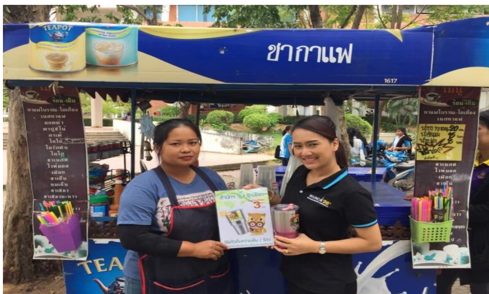
ภาพที่ 6 ผู้ประกอบการเข้าร่วมกิจกรรม

กิจกรรมที่จัดขึ้นสามารถส่งเสริมยอดขายให้กับผู้ประกอบการ เพราะเมื่อผู้ใช้บริการเห็นถึงประโยชน์ของการนำแก้วส่วนตัวมาใช้แทนการใช้แก้วพลาสติก ซึ่งนอกจากจะช่วยลดขยะในมหาวิทยาลัยแล้ว และยังสามารถนำเอาเครื่องดื่มเข้ามาดื่มในห้องสมุดได้ ทำให้อุดขายของร้านที่เข้าร่วมกิจกรรมมีจำนวนเพิ่มมากขึ้น